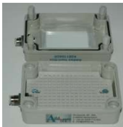
IB-K081104SR geöffnete Inert-Box