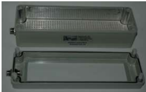
IB-K082507SR-AI geöffnete Inert-Box