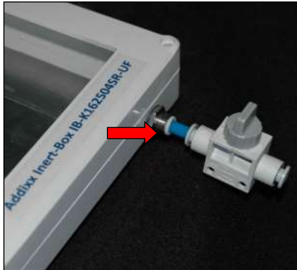
IB-K162504SR-UF Gaseinlass / Gasauslass mit Ventil